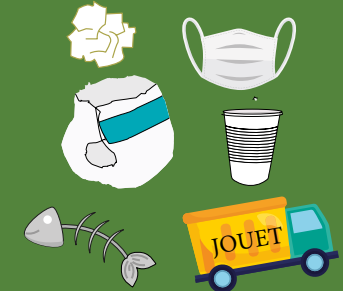
restes de repas, mouchoirs usagés, gobelets en plastique, masques, couches...