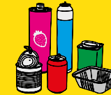
emballages en métal