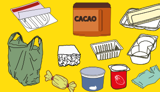
emballages en plastique