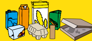
emballages en carton